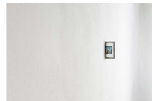
Ellipsis , 2018 Impressions digitales sur verre, support en bois Triptyque 21 x 29,7 cm /pce Édition de 3 EX + 2 EA Édition LEMOW